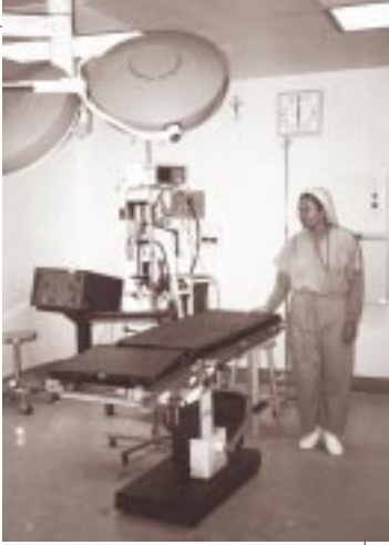
La nueva sala de cirugía obstétrica en el Hospital Regional de Quetzaltenango

La clave para el éxito de este paso es lograr soluciones concretas. El ejemplo del Paso 9 del equipo del Hospital de Sololá podría tener soluciones más detalladas y concretas. Consulte la Sección de Profundización del Diseño de Calidad (la última sección del estudio de casos) para obtener más detalles sobre cómo enfrentar mejor este paso.